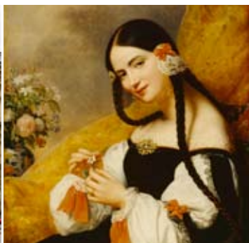
Helsingfors Stads Konstmuseum Tennispalatset